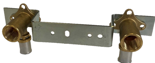
Entraxe 153 mm