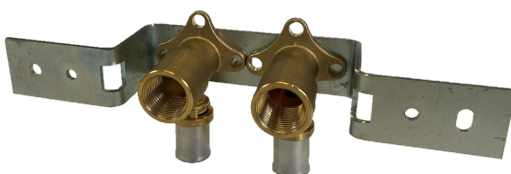
Entraxe 50 mm